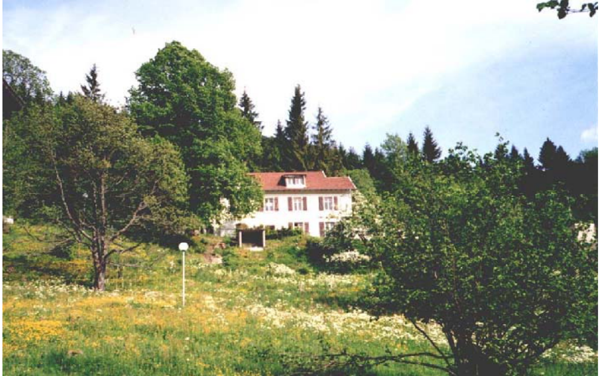
Seminarzentrum: Total Art Oasis in Bussang